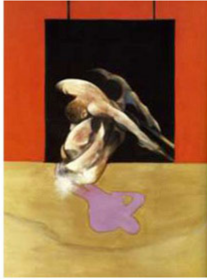
Figure in Movement, 1978 de Francis Bacon